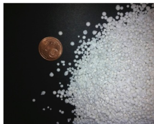
Perle di silicato espanso